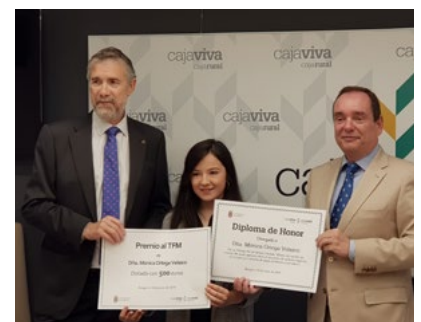
PREMIOS Y BECAS DE FUNDACIÓN CAJA RURAL BURGOS A LA INVESTIGACIÓN EN LA UBU.

Este premio dotado con 500 € se enclava en el compromiso adquirido entre la UBU y Fundación Caja Rural para el fomento y promoción de los estudios de Ing. Agroalimentaria. Además de este premio, el acuerdo tiene otras dos vertientes relacionadas con líneas de ayudas a alumnos de primer año en estos estudios que sean hijos de socios y compensaciones económicas para quienes realicen prácticas en empresas o cooperativas asociadas ■